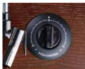
ピッチコントロールダイヤル