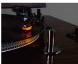
ターゲットライト