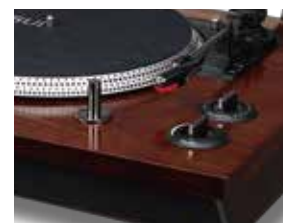
天然木突板仕上げ