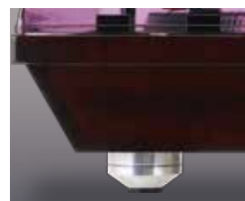
アルミ製インシュレーター